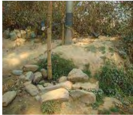
Required cross drainage structure for water management