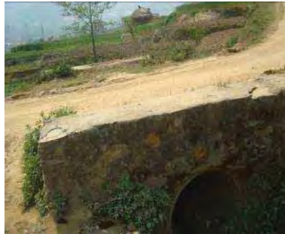
Existing cross drainage at Ch.0+837