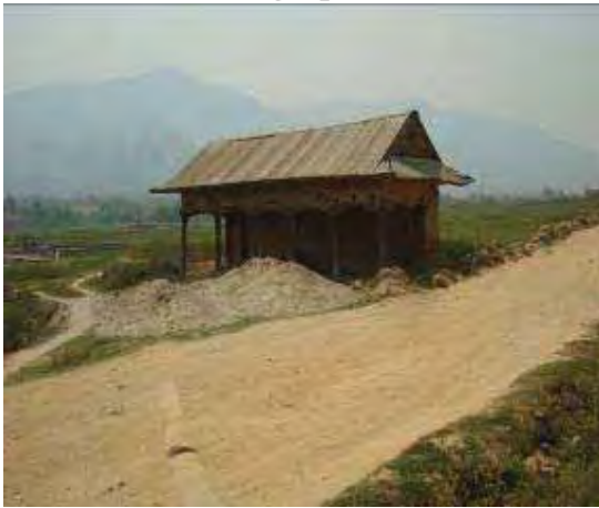
Patti at (Ch.5+797) need to relocate