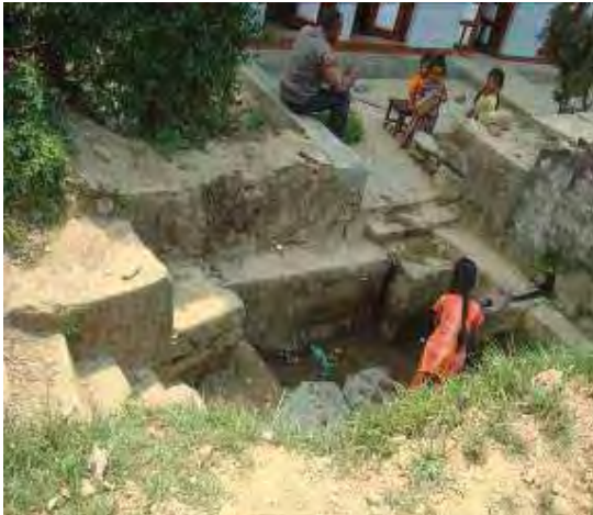
Water source/Traditional stone tap require protection work at Ch.4+537