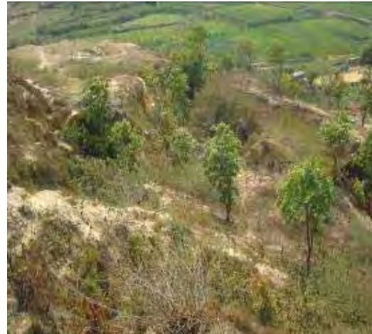
Minor landslide at Ch.1+737