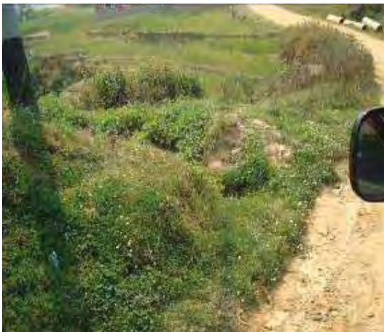
Irrigation canal crossing at Ch.1+037